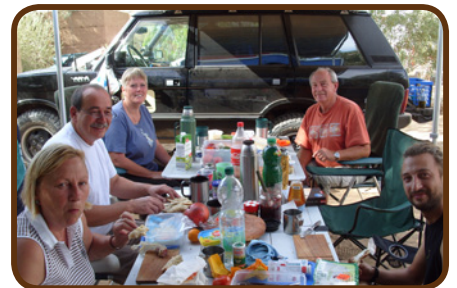
CP „Haven la Chance“

Am Dienstagmorgen, den 03.04. fahren wir vom Erg Chebbi in westliche Richtung und erreichen das fantastische Draa-Tal. Hier ist alles wieder grün und fruchtbar. Die Oase Zagora ist dann bald erreicht und der Besitzer des CP „ Oase Palmerie“ empfängt uns mit Tee und einem freundlichen Lächeln. Wir bleiben in dieser schönen Oase bis Karfreitag, um zu relaxen und uns auf den Wüstenpart vorzubereiten. Die Zeit kann für einen Stadtbummel oder Shopping genutzt werden, aber auch für Reparaturen. Es gibt eine gute Werkstatt in Zagora.