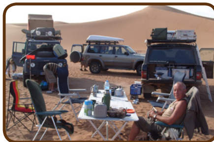
Unser 1. Wüstencamp