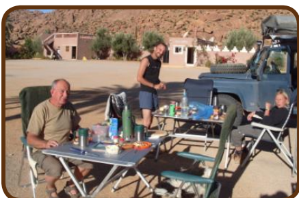
Auf dem CP "Tazka"

Am Mittwoch, den 11.04. fahren wir durch den Anti-Atlas über mehrere 2500m hohe Pässe und schauen uns den CP „Toubkal“ in Taliouine mit Sicht auf den höchsten Berg Marokkos an. Wenn es uns gefällt bleiben wir 2 Tage hier. Dann geht es spätestens am Freitag, den 13.04. durch das kurvenreiche, aber wunderbare Tal der Ammeln nach Tafraoute auf den CP „Tazka“.