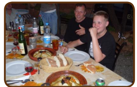
Zebra-CP in Ouzoud

Am Mittwoch nach dem Frühstück besichtigen wir die Wasserfälle und fahren weiter nach Marrakech. Nach einem Einkauf in der „Marjane“ für einen Grillabend übernachten wir auf dem CP „Le Relais de Marrakech“. Mit dem Taxi in die Stadt zu fahren kostet 5 Euro und der Place Djemaa el - Fnaa ist wie aus einem Märchen. Auf einer Dachterrasse speisen wir auf Kosten von Daily-Adventure und genießen eine Kutschfahrt. Wir brechen am Freitag über den Hohen Atlas in südliche Richtung auf.