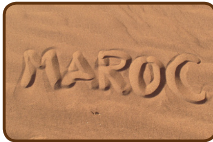
Ein schönes Land