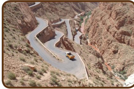
Die Dades – ein Erlebnis