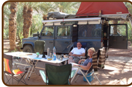
Der CP „ Oase de Palmerie“