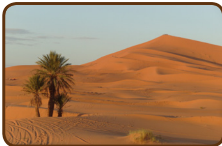
Der Erg Chebbi