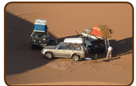
Ein Lager abseits der Piste

Am Mittwoch, den 11.04. fahren wir durch den Anti-Atlas über mehrere 2500m hohe Pässe und schauen uns den CP „Toubkal“ in Taliouine mit Sicht auf den höchsten Berg Marokkos an. Wenn es uns gefällt bleiben wir 2 Tage hier. Dann geht es spätestens am Freitag, den 13.04. durch das kurvenreiche, aber wunderbare Tal der Ammeln nach Tafraoute auf den CP „Tazka“.