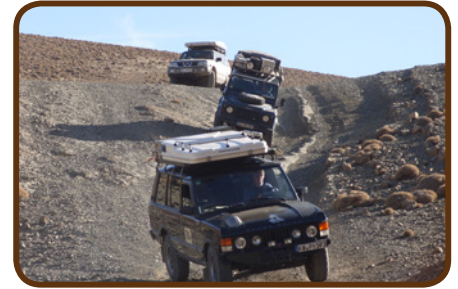
Auf Expedition – Off Road

Dann geht es weiter in die Filmstadt Ouarzazate auf den CP Municipal. Mal sehen wie der CP ist. Am Samstag, den 31.03. fahren wir über die Straße der Kasbahs zur Dades-Schlucht, haben dann eine Off-Road Strecke in 2600 m Höhe und kommen in die Todhra-Schlucht. Die Expedition ist eine Herausforderung für Mensch und Geländewagen. Die Übernachtung in der Todhraschlucht ist auf dem CP ATLAS. Am 1. April geht es an den Rand der Sahara, zum Erg Chebbi. Auf dem Weg dorthin besuchen wir ein Fossilien – Museum. Trilobiten, Ammoniten, Meteoriten kann man dort preiswert kaufen. Dann tauchen die ersten großen Dünen auf und wir übernachten direkt an der größten Düne auf dem CP „Haven la Chance“. Wir bleiben 2 Tage und genießen ein Wüstendinner von Daily-Adventure, die Ruhe am Pool und das Fahrtraining in den Dünen.