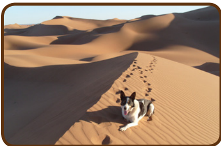
Skye im Erg Chegagga

Es geht dann am 06.04. für 3 Tage durch die Wüste. Auf den Spuren der Paris-Dakar müssen wir durch hohe Dünenkämme im Erg Chegaga, wo auch zwei Mal übernachten. Am Ostermontag erreichen wir abends Agdez mit dem CP „Kasbah de la Palmerie“. Hier werden uns nach einem Abschiedsessen die Teams verlassen, die nur 2 Wochen bei uns bleiben können. Sie fahren über Marrakech nach Tanger zurück, während der Rest der Gruppe sich auf den Anti-Atlas vorbereitet. Für diese Teams geht's am Mittwoch weiter.