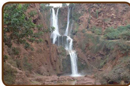
Wasserfälle bei Ouzoud