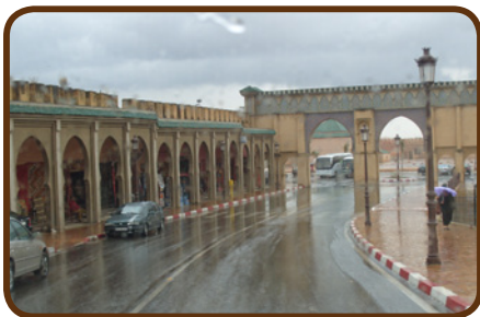
Meknes, eine Königsstadt

Am Montag, den 26.03. geht es auf der Autobahn über Rabat zur Königsstadt Meknes. Hier machen wir eine Stadtrundfahrt, einen Abstecher in die Medina, trinken Cafe au lait in einem gemütlichen Restaurant und fahren am Nachmittag zügig weiter zu unserem *****CP Euro Camping in Azrou. Dann geht es am Dienstag weiter nach Ouzoud zum CP ZEBRA www.campingzebra.com/site/?p=83&lang=de und wir genießen ein marokkanisches Abendessen, das den Daily-Adventure-Teams speziell zubereitet wird.