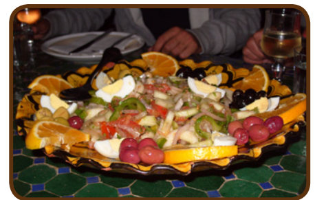
Super Essen in Marrakech

Die Berge des Hohen Atlas und die Fahrt zum PassTizi n Tichka in 2260 m Höhe sind unvergesslich. Wir fahren eine Off-Road-Strecke nach Ait Benhaddou und besichtigen das Weltkulturerbe.