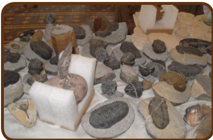
Fossilien vom Feinsten

Dann geht es weiter in die Filmstadt Ouarzazate auf den CP Municipal. Mal sehen wie der CP ist. Am Samstag, den 31.03. fahren wir über die Straße der Kasbahs zur Dades-Schlucht, haben dann eine Off-Road Strecke in 2600 m Höhe und kommen in die Todhra-Schlucht. Die Expedition ist eine Herausforderung für Mensch und Geländewagen. Die Übernachtung in der Todhraschlucht ist auf dem CP ATLAS. Am 1. April geht es an den Rand der Sahara, zum Erg Chebbi. Auf dem Weg dorthin besuchen wir ein Fossilien – Museum. Trilobiten, Ammoniten, Meteoriten kann man dort preiswert kaufen. Dann tauchen die ersten großen Dünen auf und wir übernachten direkt an der größten Düne auf dem CP „Haven la Chance“. Wir bleiben 2 Tage und genießen ein Wüstendinner von Daily-Adventure, die Ruhe am Pool und das Fahrtraining in den Dünen.