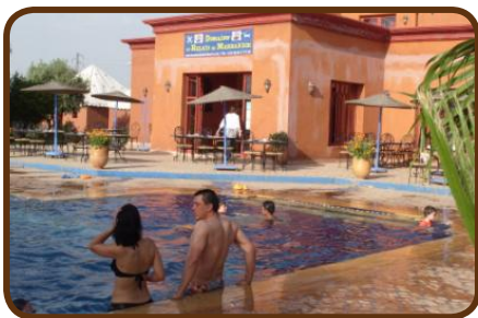
Der *****CP „Le Relais“

Am Mittwoch nach dem Frühstück besichtigen wir die Wasserfälle und fahren weiter nach Marrakech. Nach einem Einkauf in der „Marjane“ für einen Grillabend übernachten wir auf dem CP „Le Relais de Marrakech“. Mit dem Taxi in die Stadt zu fahren kostet 5 Euro und der Place Djemaa el - Fnaa ist wie aus einem Märchen. Auf einer Dachterrasse speisen wir auf Kosten von Daily-Adventure und genießen eine Kutschfahrt. Wir brechen am Freitag über den Hohen Atlas in südliche Richtung auf.