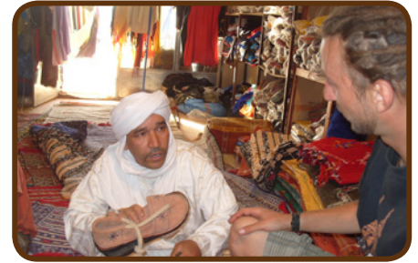
Einkauf in Zagora

Es geht dann am 06.04. für 3 Tage durch die Wüste. Auf den Spuren der Paris-Dakar müssen wir durch hohe Dünenkämme im Erg Chegaga, wo auch zwei Mal übernachten. Am Ostermontag erreichen wir abends Agdez mit dem CP „Kasbah de la Palmerie“. Hier werden uns nach einem Abschiedsessen die Teams verlassen, die nur 2 Wochen bei uns bleiben können. Sie fahren über Marrakech nach Tanger zurück, während der Rest der Gruppe sich auf den Anti-Atlas vorbereitet. Für diese Teams geht's am Mittwoch weiter.