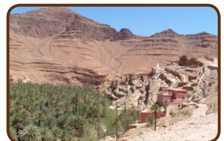
Im Tal der Ammeln