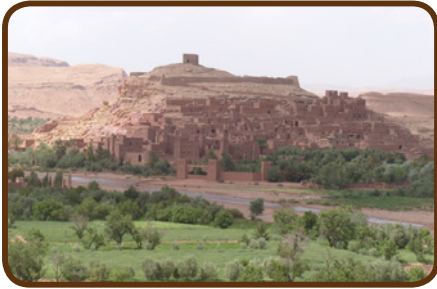
Ait Benhaddou – so schön!