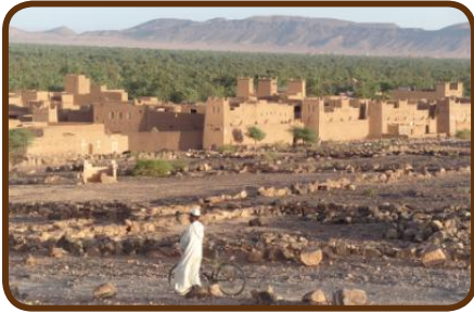
Das fantastische Draa-Tal