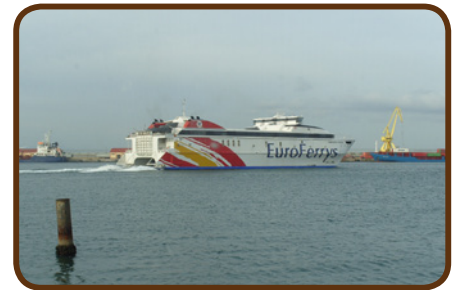
Auf Wiedersehen Marokko

Am Mittwoch den 18.04. fahren wir über die Autobahn nach Marrakech, Rabat und übernachten in Moulay Bouselham, denn am nächsten Morgen wollen wir auf die Fähre nach Algeciras. Dann tingeln wir in drei bis fünf Tagen nach Deutschland zurück, so dass wir spätestens am Donnerstag, den 26.04. wieder zu Hause sind.