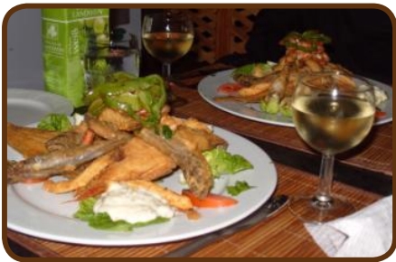
Die Fischplatte, ein Gedicht

Am Sonntag fahren wir auf einer sehr schönen Strecke nach Agadir und kaufen in einem großen Supermarkt ein, denn unsere Vorräte sind langsam am Ende. Der CP „Atlantica Parc“, der keine Wünsche offen lässt, liegt 30 km nördlich von Agadir und die Stadt ist schnell erreichbar, um Souvenirs zu kaufen. Wir machen am Dienstag, den 17.04. ein Abschiedsessen und genießen die Grill-Fischplatte im Restaurant in der Nähe des CP.